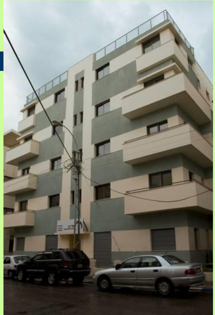
חזית מערבית בסיומה