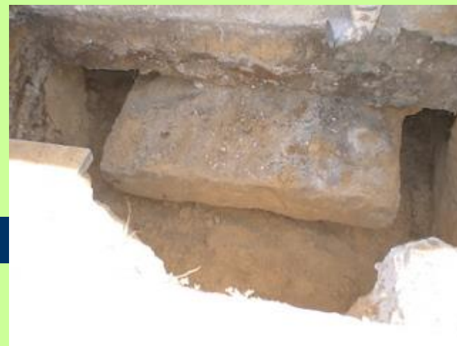
- חפירה לצורך עיבוי יסודות