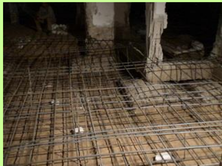
- הכנות סופיות ליציקת הרפסודה