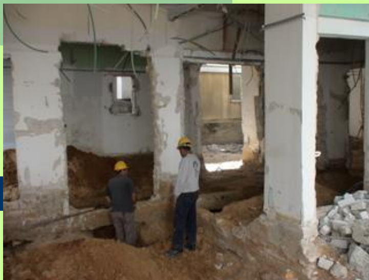
- חפירה והכנות לרפסודה