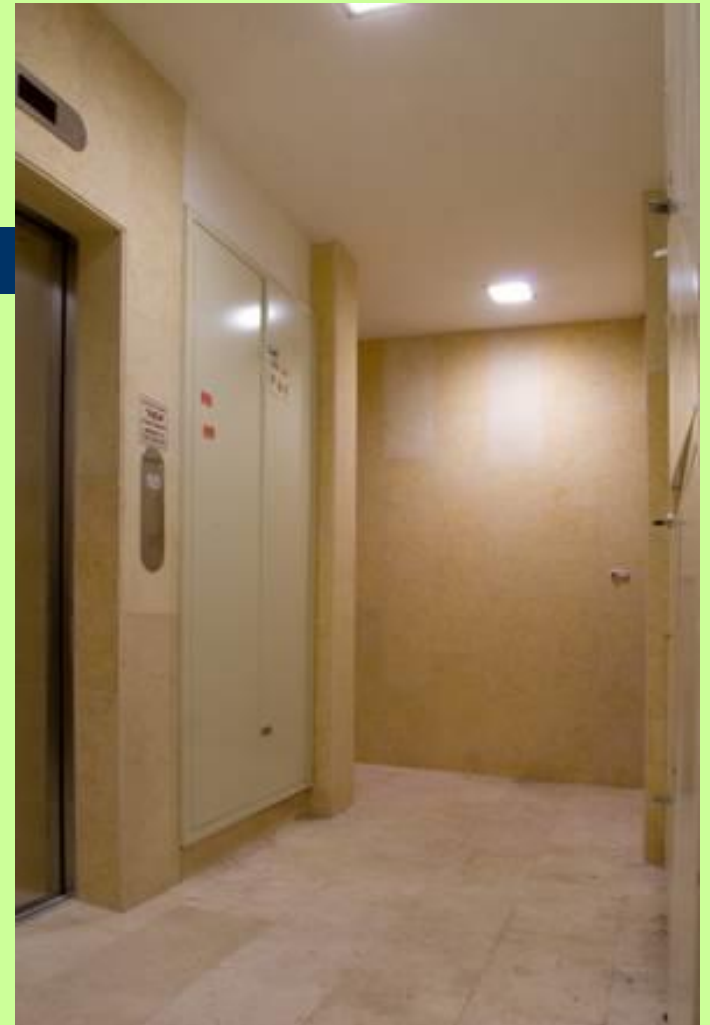
- לוביים קומתיים