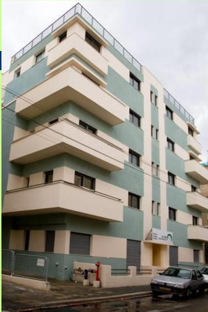
חזית צפון מערבית בסיומה