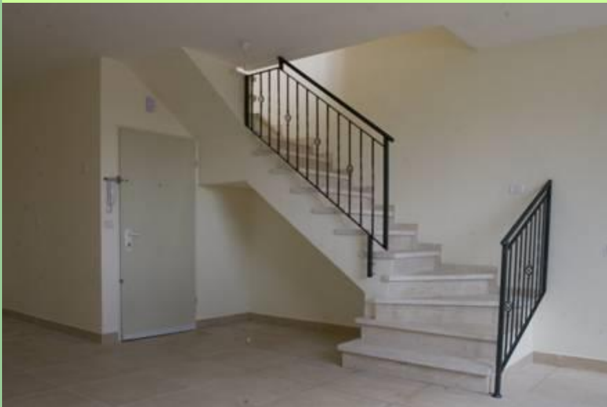
- מדרגות עלייה לפנטהאוז