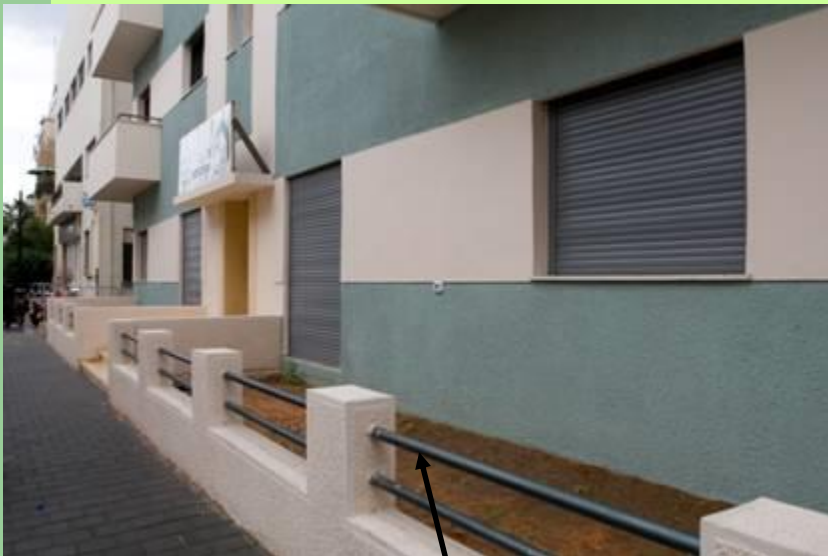
שילוב מעקות מתכת כדוגמת המקור

ביצוע גדרות חוץ כפי שנבנו במקור בשילוב מסגרות וביצוע טיח על גדרות כפי שבוצע במקור