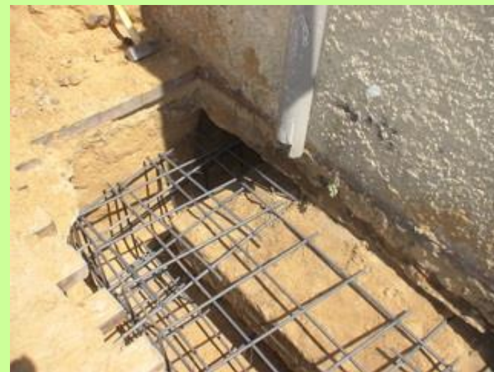
- ביצוע זיון להרחבת יסודות