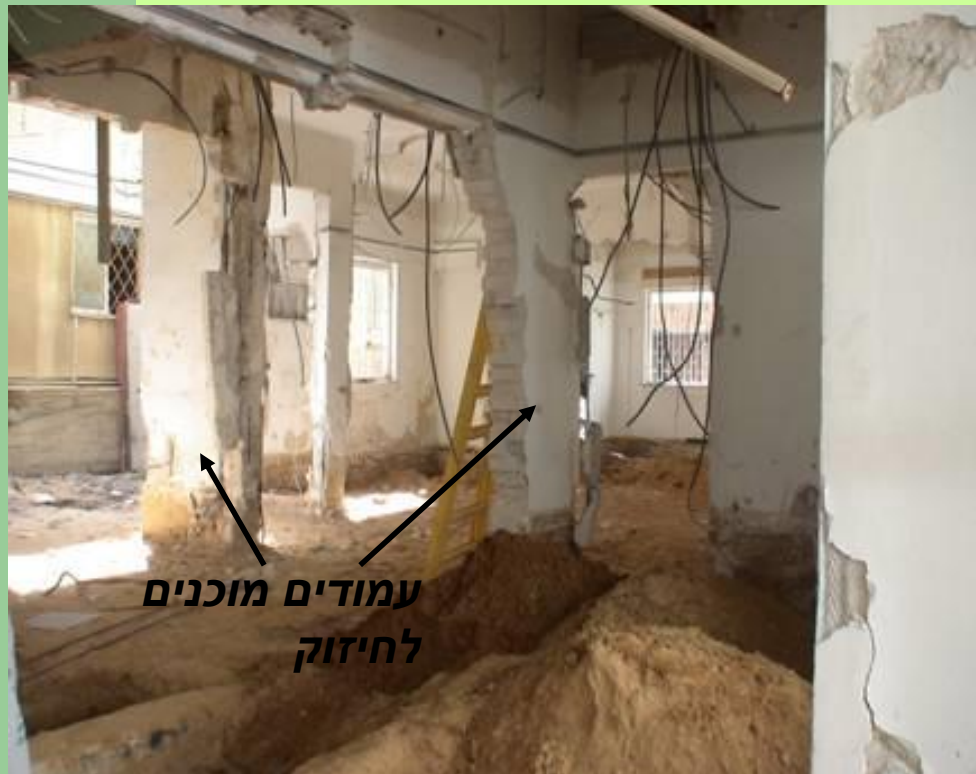
עמודים מוכנים לחיזוק