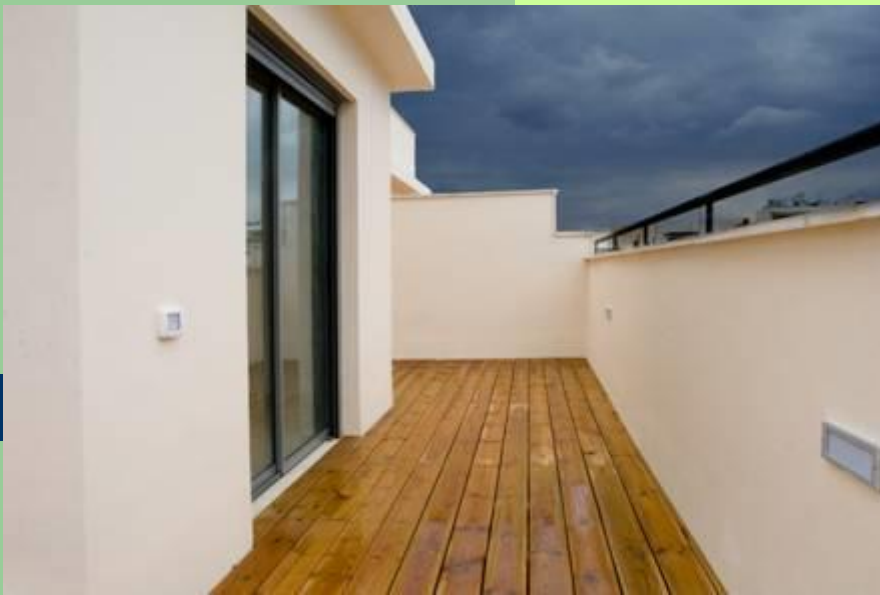
- דירות גג וחיפוי דק