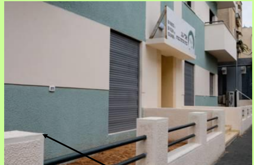
טיח פינתי מיוחד משולב בשפריץ